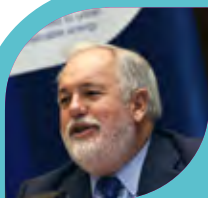
Miguel Arias Cañete

Tyto úřady se zavázaly rozvíjet Akční plány pro udržitelnou energii a klima pro rok 2030 a zavádět lokální činnosti pro zmírňování a přizpůsobování se změně klimatu .