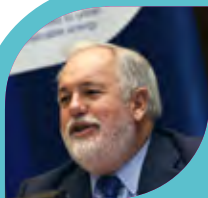
Miguel Arias Cañete

He sitoutuvat kestävien energiamuotojen kehittämiseen ja ilmastoa koskeviin toimintasuunnitelmiin vuoteen 2030 saakka sekä paikallisen ilmastomuutoksen hillitsemiseen ja sopeuttamistoimintoihin .